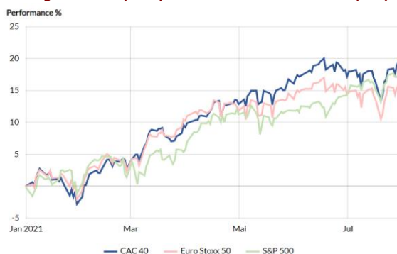
Progression des principaux indices boursiers en 2021 (YTD)