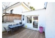
Maison T2 avec terrasse Caudéran 42 m 2 239 200€ FAI