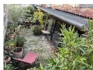
Appartement T3 avec terrasse Quinconces 100 m 2 987 000€ FAI