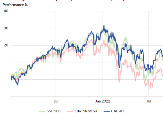
Progression des principaux indices depuis janvier 2021