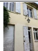
Maison à rénover Caudéran – 115 m 2 3 chambres - jardin et garage 416 000 € FAI