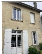
Maison familiale St Bruno/St Genès – 185 m 2 5 chambres - jardin et garage 990 000 € FAI