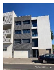
Appartement avenue Arès – Caudéran 2 chambres – 1 er étage avec loggia et garage 370 000 € FAI