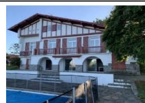
Maison à Espelette – 320 m 2 5 chambres – Pool-house et piscine 1 200 000 € FAI - Exclusivité