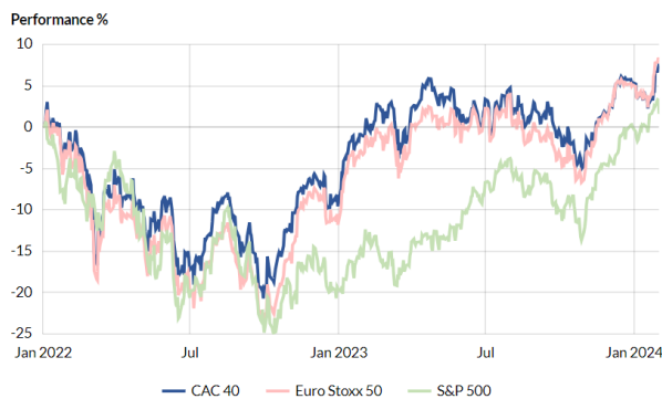
Progression des principaux indices depuis janvier 2022